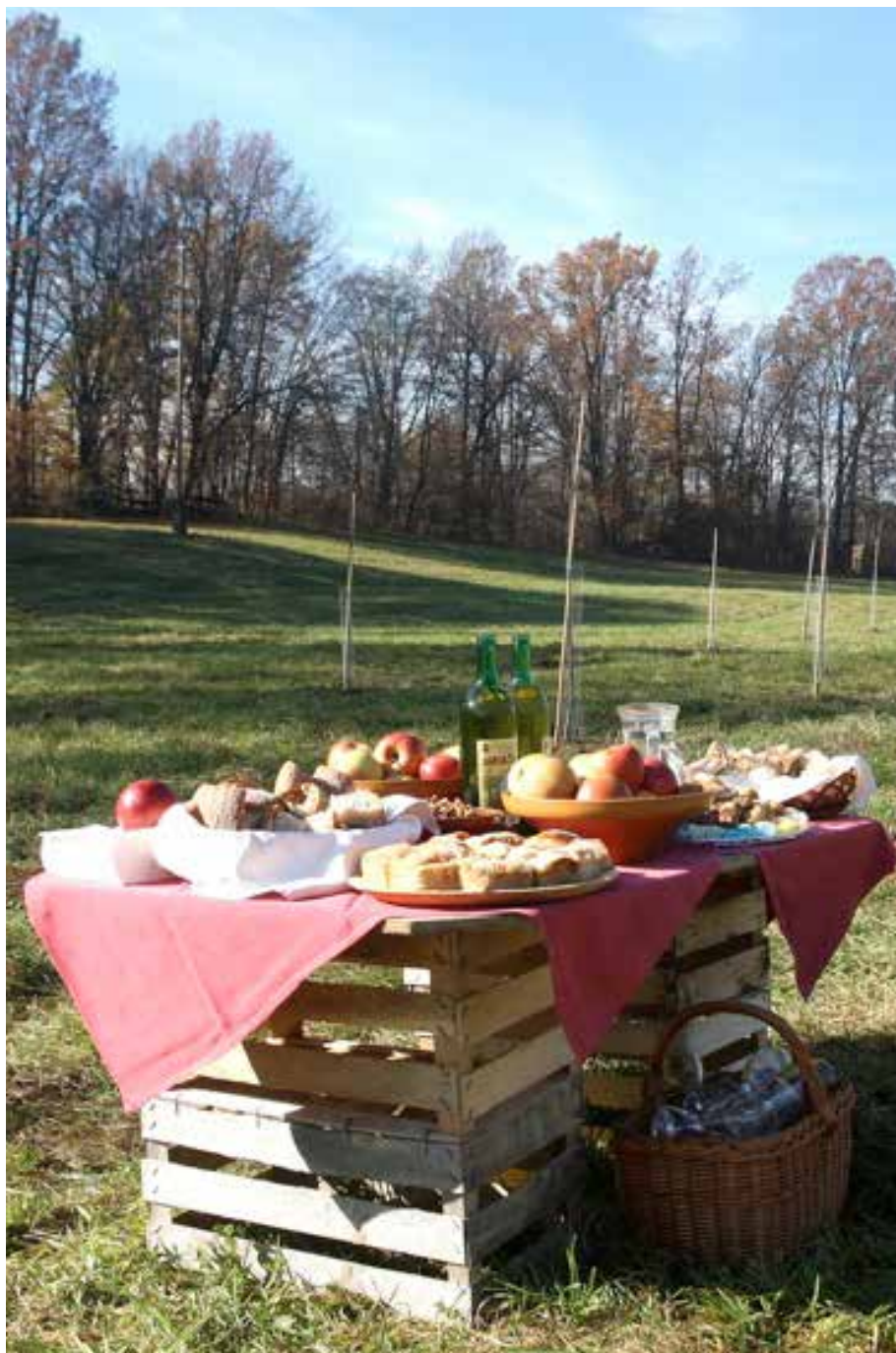
Odprtje prvega javnega sadovnjaka v Ljubljani