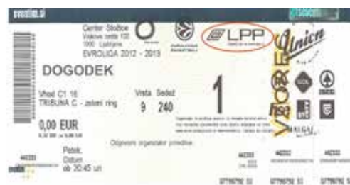
Primer vstopnice, ki omogoča brezplačno potovanje z LPP.